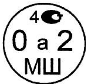
Рисунок 4.1. Знак поверки государственного регионального центра метрологии