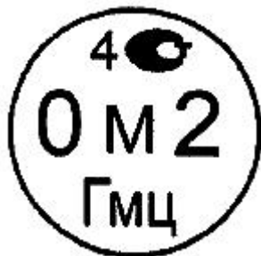
Рисунок 4.2. Знак поверки государственного научного метрологического института